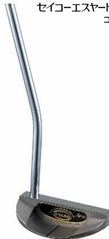
< S - YARD SP - 22 >