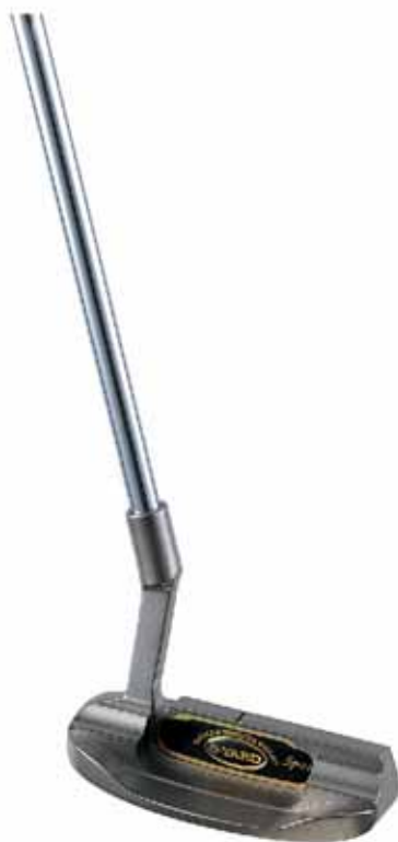
< S - YARD SP - 21 >

S - YARDから新しいパター、2つのラインアップで新登場！ 08年モデル キャディバッグ&ボストンバッグも新発売！